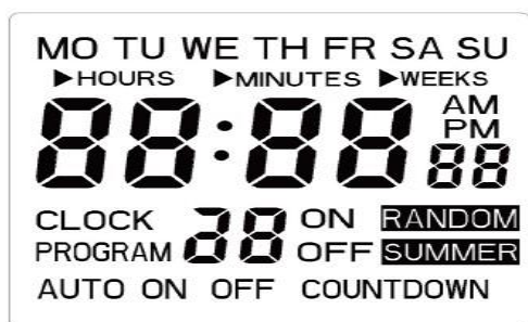
obr.1 LCD displej